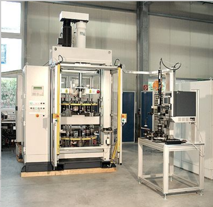
Halbautomatische, flexible Montagepresse für Getriebewellen-Vormontage