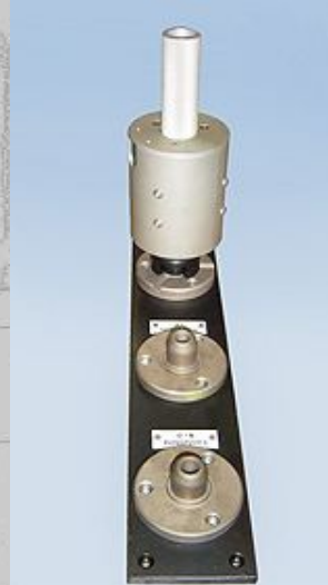
Prüfglocke für Sicherungsringmontage, Sicherungsring i.O. montiert, Sicherungsring n.i.O. montiert, Sicherungsring nicht vorhanden