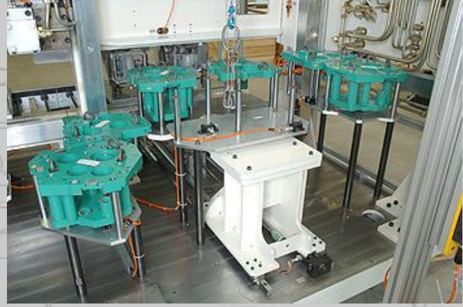
Meister zum Kalibrieren der Messmaschine