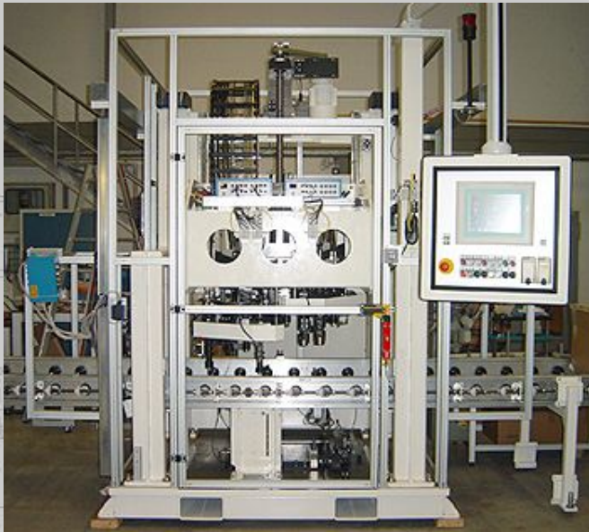
Vollautomatische Messmaschine zur Passscheibenbestimmung in einer Getriebemontagelinie - gemeinsame Messung von Gehäusen und Wellen - Wellen sind in das Kupplungsgehäuse eingesetzt