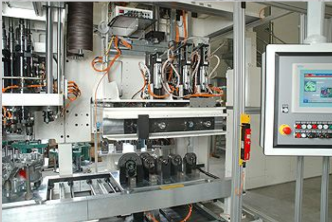
Dynamisches Vermessen der Getriebewellen mit Lagerschalen unter Last