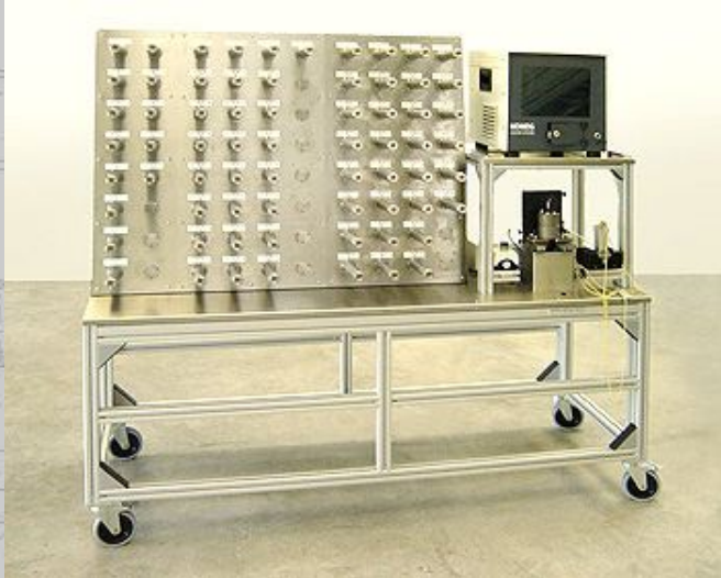
Scheibenmagazin für Passscheiben mit Gegenmessvorrichtung und Meßrechner