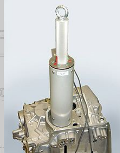
Handmessglocke zur Nutbreitenmessung für Sicherungsringbestimmung