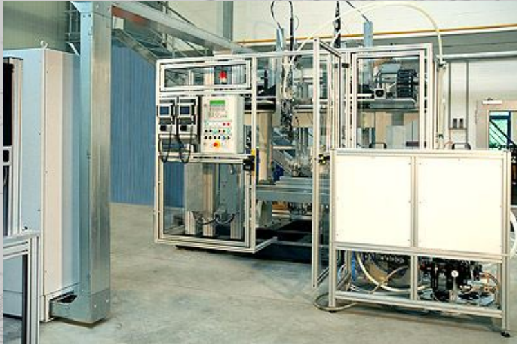
Vollautomatische, flexible Schraubstation für Getriebegehäuse, Schraubenzuführtechnik mit Einschuss in Schrauberzange