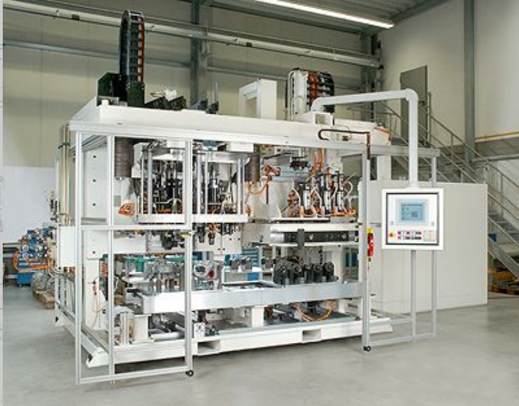
Vollautomatische Messmaschine zur Passscheibenbestimmung in einer Getriebemontagelinie - getrennte Messung von Gehäusen und Wellen